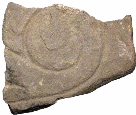
Figur 2. Sandstensfragmentet från undersökningen i Bälinge kyrka 2009. UM41776-x, F50.

sandstensfragment som skulle kunna vara delar av en eskilstunakista vid Spånga kyrka. 5